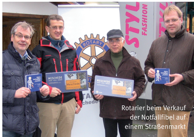
Rotarier beim Verkauf der Notfallfibel auf einem Straßenmarkt

Mit der „Kleinen Notfallfibel für Säuglinge und Kleinkinder“ will der RC Meschede-Warstein wertvolle Tipps an Eltern und Großeltern vermitteln und zugleich seinen Beitrag für END POLIO NOW leisten. Die erste Auflage von 2.000 Exemplaren zum Stückpreis von 6,90 Euro ist so gut wie ausverkauft. Wesentlichen Anteil daran hatte die Bestellung von 500 Exemplaren für das Walburga Krankenhaus in Meschede. Aktuell gibt es viele Anfragen, die weitere Auflagen – auch in mehreren