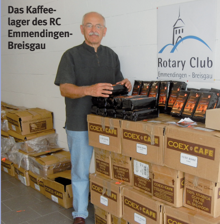
Das Kaffeelager des RC Emmendingen-Breisgau

Wer fairen Kaffee trinken und zugleich die Polio-Kampagne unterstützen will, kann beim RC Emmendingen-Breisgau seine Bestellung aufgeben. Der Club hat bereits 2009 aus Kaffeeverkäufen 1600 Euro für die Kampagne gespendet und für die neue Runde 800 kg Kaffee aus den Höhenlagen von El Salvador geordert. Im Angebot sind Gourmetkaffee gemahlen oder in ganzer Bohne sowie Espresso in ganzer Bohne. Preis: jeweils 11 Euro pro Pfund. Vom Spendenanteil können jeweils acht Kinder geimpft werden. Näheres und das Bestellformular unter www.rotary.de/emmendingen_breisgau und dort unter Menüpunkt „Projekte“.