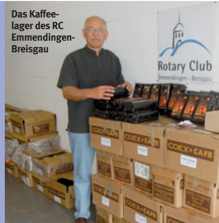
Das Kaffeelager des RC Emmendingen-Breisgau

Wer fairen Kaffee trinken und zugleich die Polio-Kampagne unterstützen will, kann beim RC Emmendingen-Breisgau seine Bestellung aufgeben. Der Club hat bereits 2009 aus Kaffeeverkäufen 1600 Euro für die Kampagne gespendet und für die neue Runde 800 kg Kaffee aus den Höhenlagen von El Salvador geordert. Im Angebot sind Gourmetkaffee gemahlen oder in ganzer Bohne sowie Espresso in ganzer Bohne. Preis: jeweils 11 Euro pro Pfund. Vom Spendenanteil können jeweils acht Kinder geimpft werden. Näheres und das Bestellformular unter www.rotary.de/emmendingen_breisgau und dort unter Menüpunkt „Projekte“.